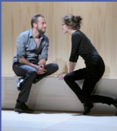
Constellations © Bruno Dewaele

Ce n'est donc pas un couple lambda mais la multitude des possibles d'une relation amoureuse qui se déploie sous nos yeux, au prisme des variations de la vie, de l'amour, de la mort, du temps... Et ce qui pourrait n'être qu'un exercice de style devient un hymne à la liberté aussi léger que bouleversant, porté par deux acteurs frémissants de vérité.